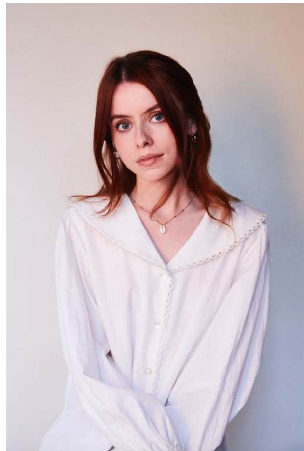
Rosie Day Dramatiker

Jag blev kontaktad efter att pjäsen hade haft premiär om att skriva en bok vilket också har varit väldigt roligt. Man kan säga att boken är en guide för tonårstjejer som vill överleva tonåren.